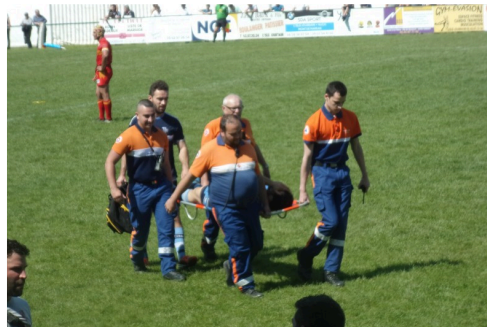
Joueur fleurantin évacué