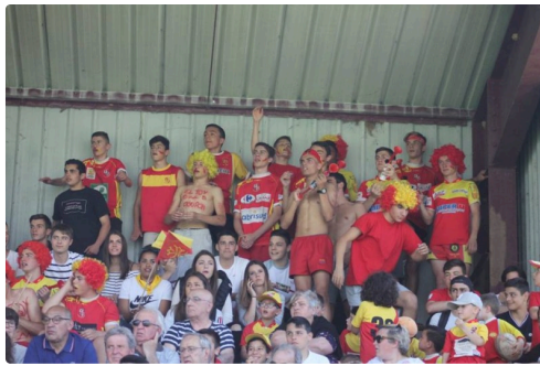
Les supporters lislois