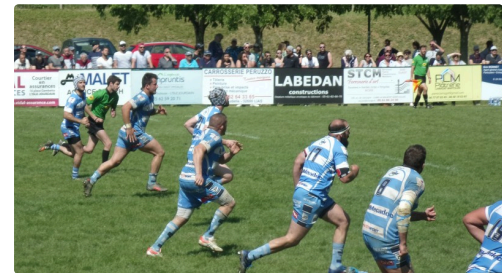
Equipe de Fleurance en attaque