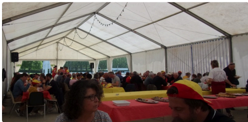
Buffet d'avant rencontre

A noter un "super" buffet d'avant match était proposé par l'USL, encore une fois une très bonne organisation.