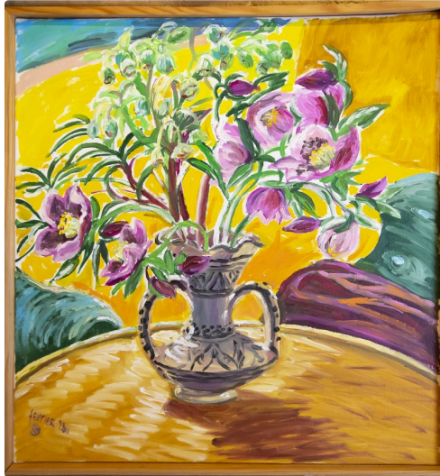
Vase avec fleurs