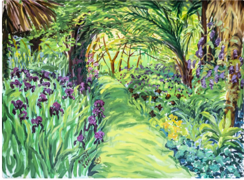
Une allée qui pourrait être dans la Palmeraie