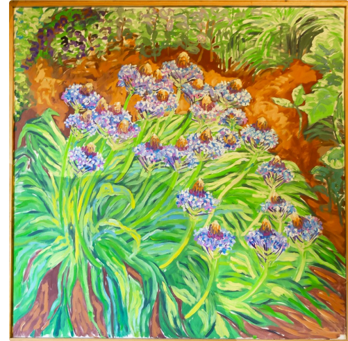
Scilles du Pérou