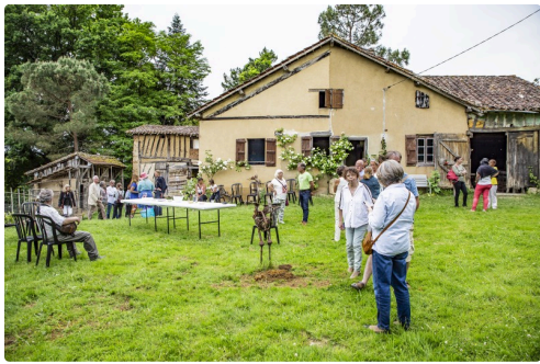
La ferme de Pépé pendant le vernissage