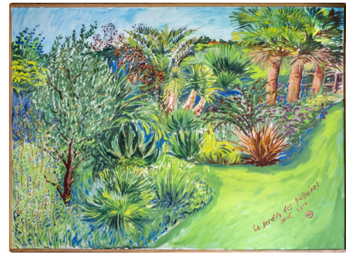
"Peggy Kluck peint ls palmiers comme personne"