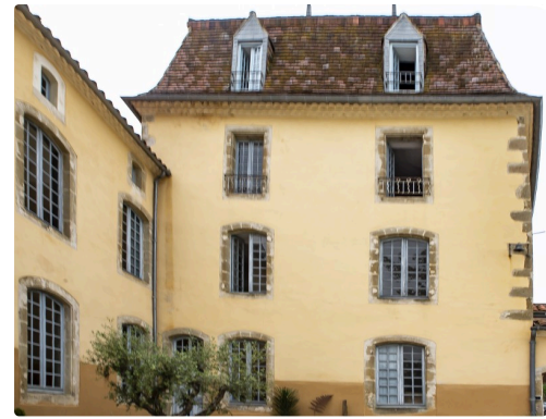
Autre aspect du château