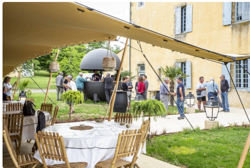
Accueil sur une terrasse (à l'arrière-plan, le bar "pomme")