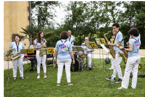
L'Harmonie de Lupiac joue pour les invités