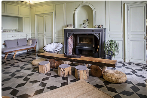
Pièce à vivre