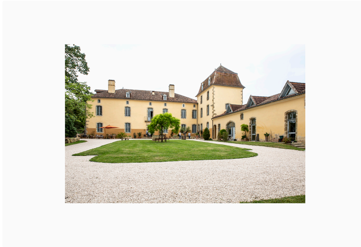
L'hébergement au château - qui manquait à Lupiac