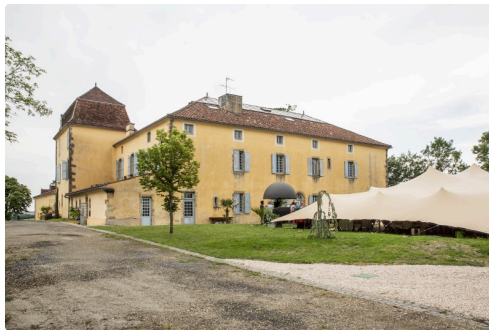
Un aspect du château avec la terrasse et la toile tendue