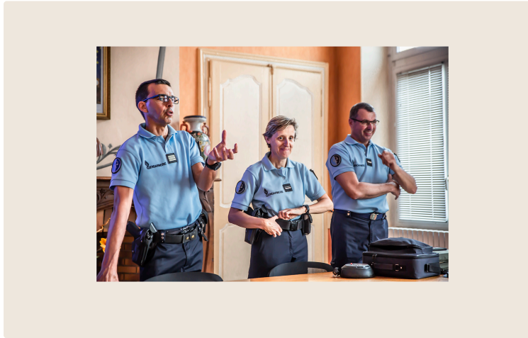
Les gendarmes renouent avec la population de Nogaro (entre autres)

Un contrat opérationnel souple et révisable en est la marque