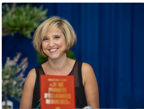
Valentine Goby et son roman "Je me promets d'éclatantes revanches"