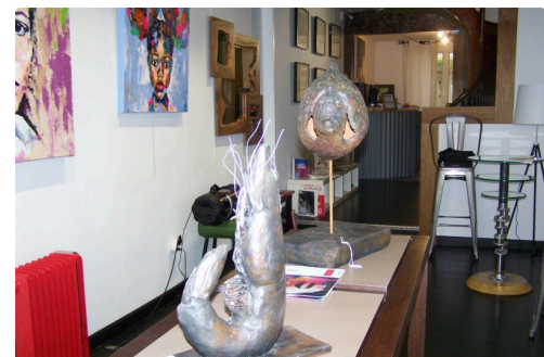
Sculptures de Solène Lebre