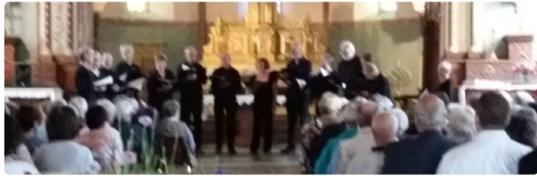
Resized_20180603_174148_7551 - Copie.jpeg