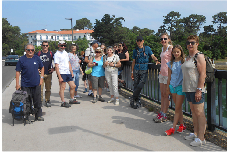
Un week end landais pour le club des coteaux

Le club des coteaux de Lagardère vient d'effectuer une sortie au lac de Seignosse dans les Landes. Il s'agissait de la sortie annuelle programmée sur trois jours, du vendredi 1ier au dimanche 3 juin. Les 21 participants se sont retrouvés au camping au nord du village avec un accès direct sur la plage, un accès pour la promenade en vélo ou bien à pieds dans la forêt landaise. A près une première nuit toute l'équipe était prête à découvrir le nouveau paysage landais. Pour ce samedi 2 juin un groupe de 15 personnes a opté pour une randonnée pédestre de 12kms et un autre groupe de 6 a choisi la promenade en vélo sur un circuit de 24kms dans la forêt landaise et le littoral, l'après-midi quartier libre pour flâner à sa convenance selon ses envies. Rassemblement en soirée autour d'un repas partagé très convivialement au camping. Pour le dernier jour dimanche, tous ensemble à pieds ils ont fait le tour du lac d'Hossegor, vestige de l'ancien estuaire de l'Adour, ce lac est alimenté par les eaux de l'atlantique et se vide presque complètement à chaque marée avant de se remplir de nouveau. A midi le repas à Capbreton, citée marine avec ses superbes paysages, puis une dernière flânerie dans ce cadre reposant avant de prendre la route du retour pour conclure ce weekend qui laissera pleins de bon souvenirs à tout le monde.