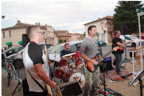
l'orchestre en action