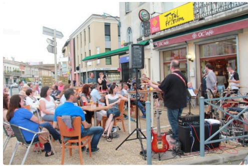
le public du Ocafé