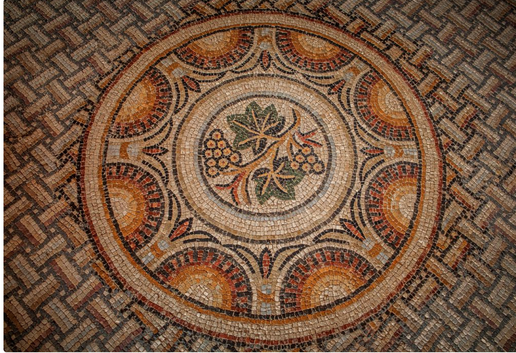
Association La Mésange Bleue

Le bureau de l'Association culturelle de la Mésange bleue, informe, de l'annulation de la sortie prévue le 16 juin à Lauzerte et à Moissac car son coût est trop élevé ; Aussi elle propose pour la traditionnelle journée patrimoine pique-nique une autre destination moins éloignée qui a pour cadre le département.