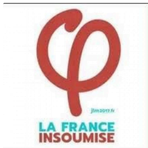
le logo de la France Insoumise

Il conclut en déclarant : "L'Humanité de demain se construit aujourd'hui. -Fidèle et accueillante- : L'Isle-Jourdain doit le rester, aujourd'hui et demain ».