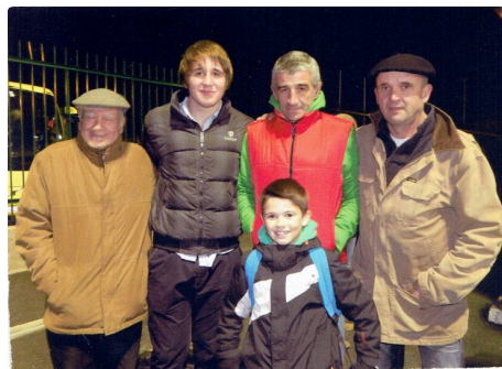
Chez Jelonch le rugby est une affaire de famille