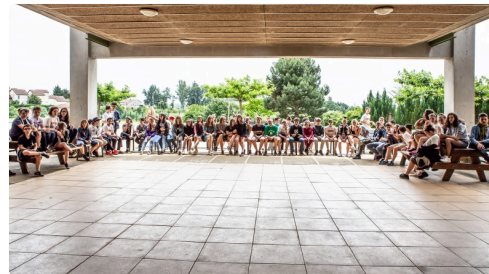
Les collégiens sont rassemblés pour la cérémonie