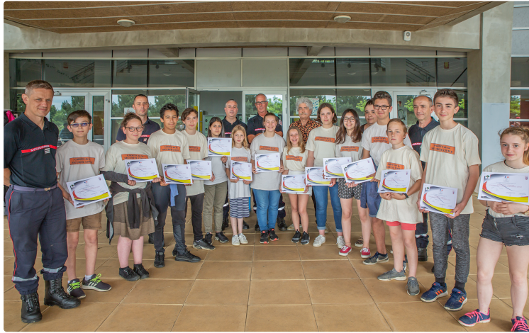
Des collégiens d'Aignan diplômés de la sécurité civile

Ils sont formés par les sapeurs-pompiers