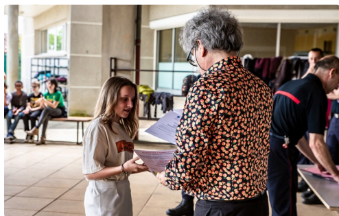
Remise de diplôme par le principal