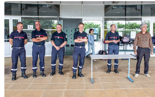
Les cadres sapeurs-pompiers et le principal face aux collégiens