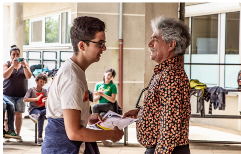
Remise de diplôme par le principal