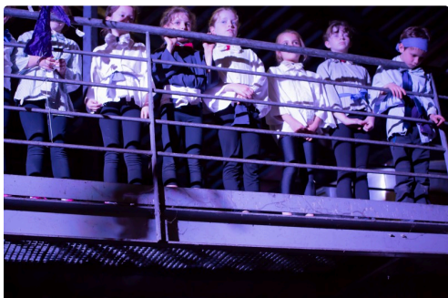
Les enfants chantent du haut d'une passerelle