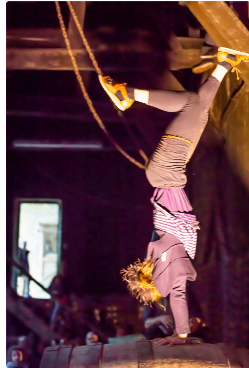
Acrobaties sur les barriques