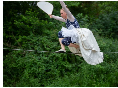
...se relève doucement