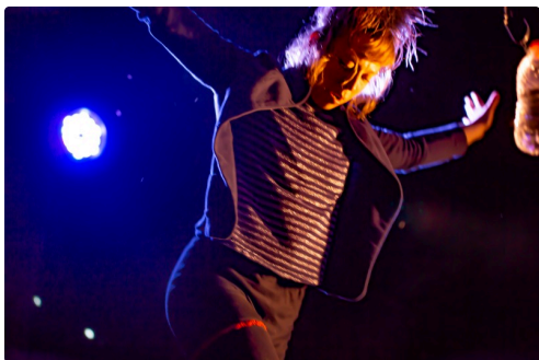
Passage d'une poutre étroite