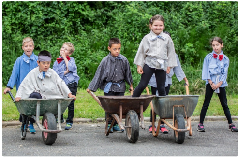
Les petits acrobates