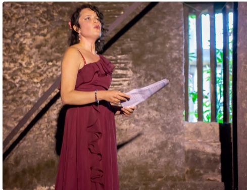
Dans le chai, la chanteuse perchée sur une barrique en hauteur