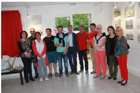
les élus qui s'investissent autour d'Escota è Minja