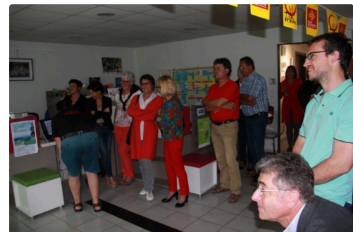
ceux qui assistent