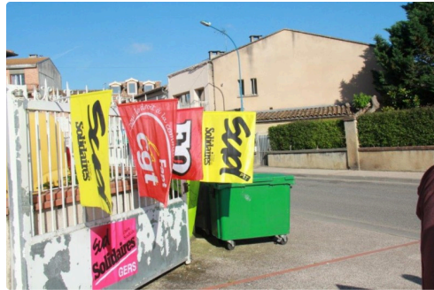
les organisations représentatives