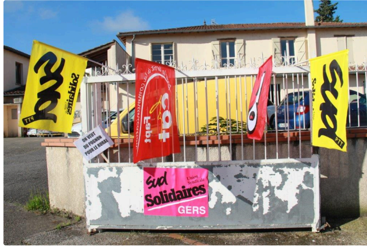
Rencontre des militants vicois avec les postiers lislois

Des précisions sur les raisons de la grève