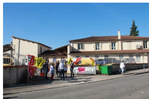
effervescence ce matin à la Poste de L'Isle-Jourdain

Ce mardi 19 juin 2018 la poursuite de la grève des facteurs de Vic-Fezensac a été votée à l'unanimité, après 22 jours de grève.