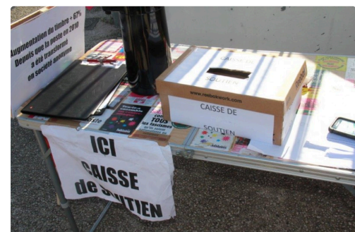
la caisse de solidarité