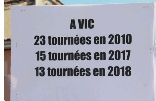
panonceau pour ce qui arrive à Vic