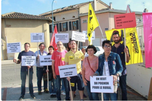
manifestation des Vicois en colère