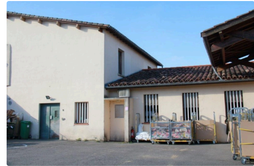
les services du tri lillois