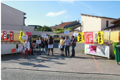
les manifestants vicois devant la cour du tri lillois