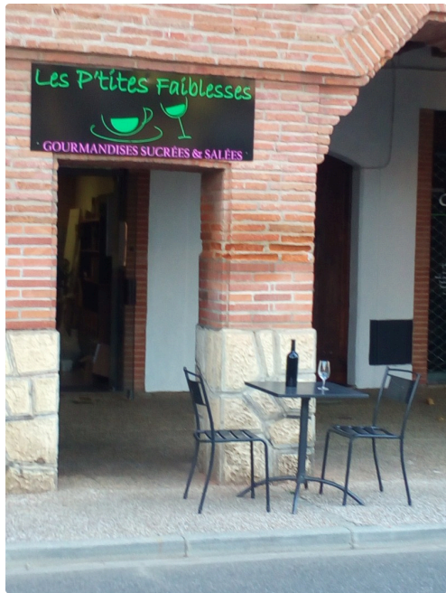
aux petites faiblesses ensembles des élèves de l'école de musique, un jeune rappeur et quatuor de clarinettes "ForThé"