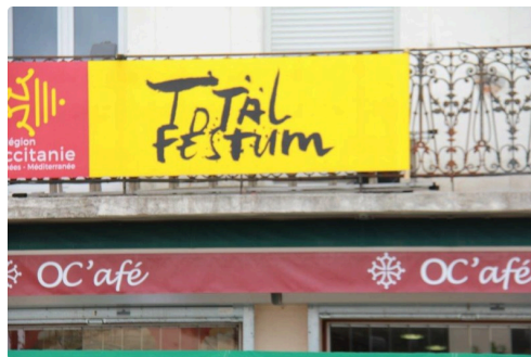
Oc'afé, chants italiens et musique des années 80 et peut être la Pole Dance