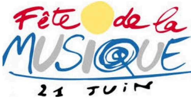
manifestations de la fête de la musique chez les Lislois

Cette année la commune bouge de plus en plus