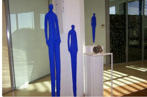
Sculptures de Béatrice Fernando ( Gers )