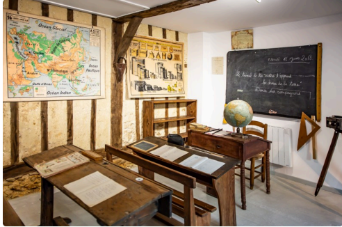
La classe d'autrefois