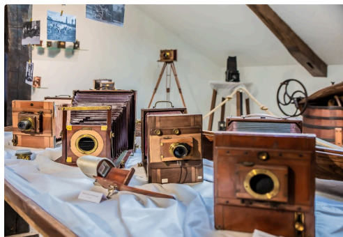
Les chambres photographiques en gros plan

L'exposition a trouvé sa place à côté de la reconstitution de la classe d'une école d'autrefois, avec son tableau noir, ses cartes de géographie, ses tables avec trou pour l'encrier et banc incorporé. Et, dans cette salle lumineuse, on peut faire encore d'autres trouvailles.