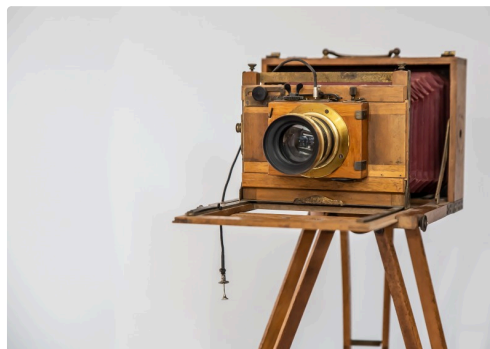
Chambre avec pied en bois