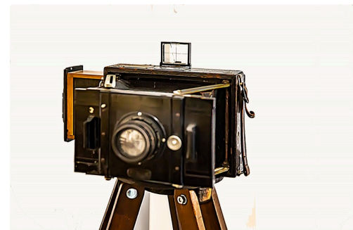
Autre appareil à plaque avec pied en bois