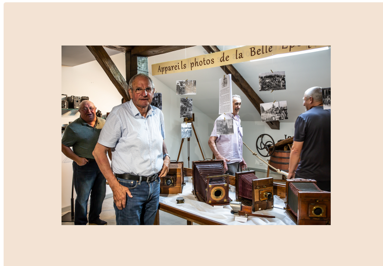
Des appareils photo anciens au Musée de Toujouse

En situation dans une salle de classe 1900