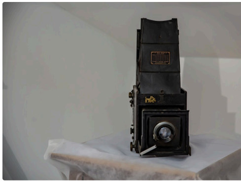
Le RB Tele Graflex 1915-1923