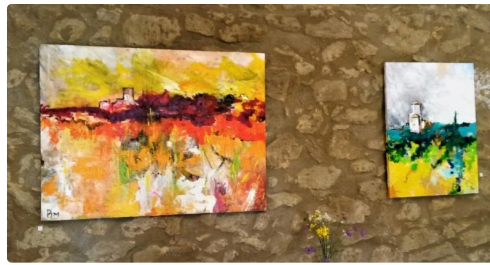
Les peintures de Pim Harren