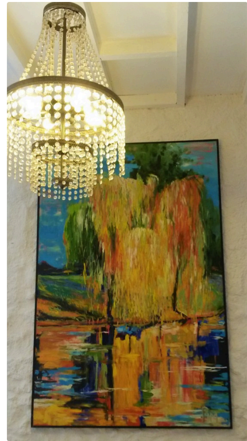
Cascade de lumière et de couleurs