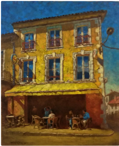
Un café très connu des Vicois