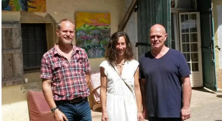
La Big Galerie s'ouvre à l'art

Surplombant les collines qui mènent par des chemins buissonniers au village de Saint-Pierre-d'Aubézies, la toute nouvelle Big Galerie a ouvert ses portes au public dimanche 24 juin.