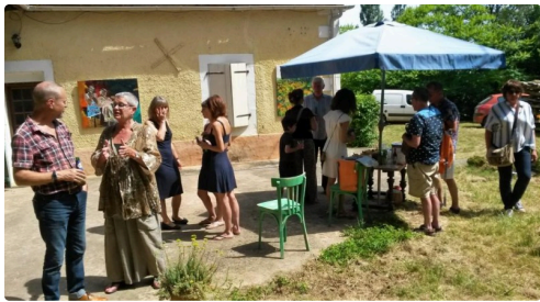
Lors du vernissage