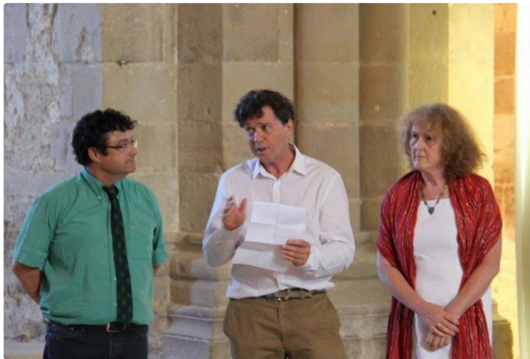
Art contemporain à l'abbaye de Flaran

La Conservation départementale du Patrimoine et des Musées du Gers poursuit le travail engagé autour de l'art contemporain, initié cette saison par la présence des œuvres de Barbara Schroeder dans les jardins ainsi que par une nouvelle exposition de peintures de l'artiste Paul Storey.