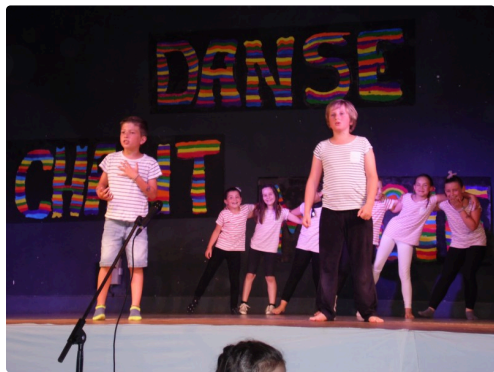
du 23 juin 2018