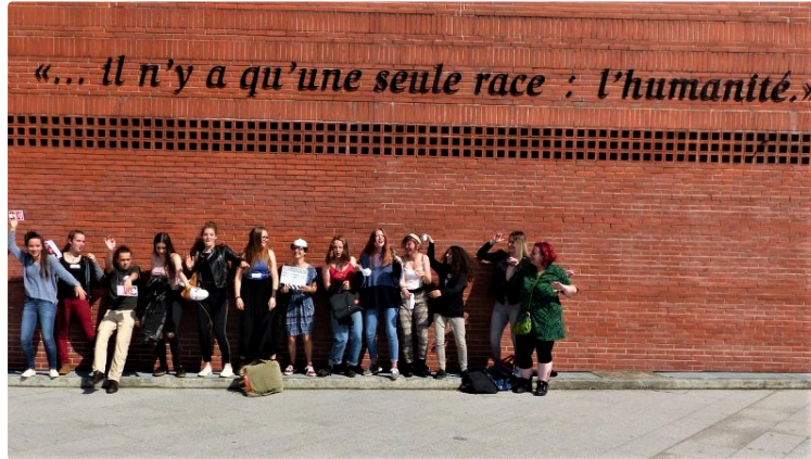
Discrimétrages: Clap d'or 2018 pour le Lycée du Garros.