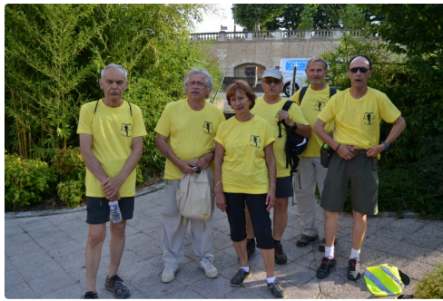
L'équipe encadrante des Marcheurs gascons.