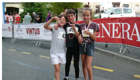
Ils ont bien mérité leur médaille.