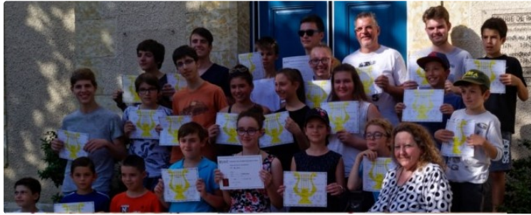
École de musique : Une année s'achève.

En cette fin d'année musicale, quoi de plus parlant qu'un petit montage photo pour présenter l'école de Musique de Pavie ( EDM ) ?