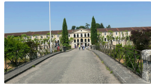
Les bâtiments rive gauche.