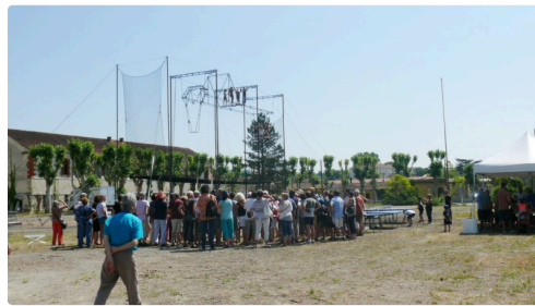
Sur la place d'arme rive droite, les Circassiens font du trapèze.