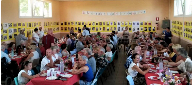
Les « Pierramides », fil de la vie locale

C'est en ce chaud dimanche 1er juillet que « Les Pierramides » ont vu le jour. Et il y avait du monde autour du berceau !