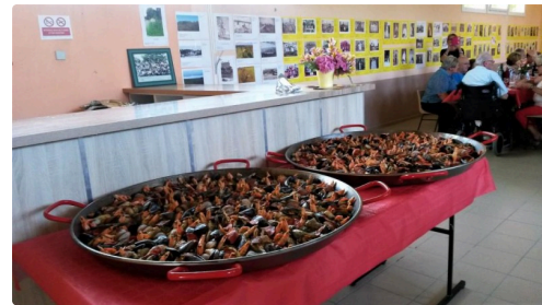
La paëlla géante sera très appréciée