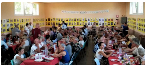
Un moment convivial qui marquera la vie de la commune