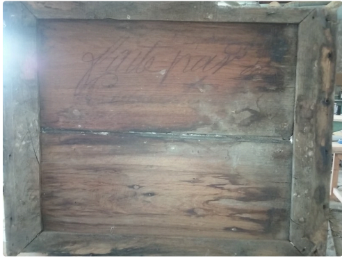
La porte datée de 1823 avant d'être réhabilitée portait la signature de Gabriel Couget artisan menuisier ébéniste au quartier de "Rapine" à plaisance