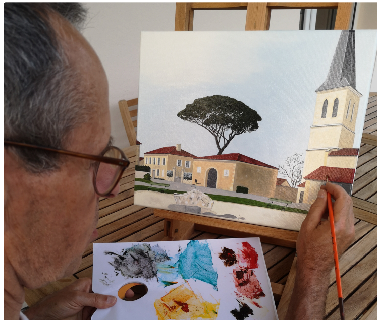
Deux expositions de peinture à Roques cet été !