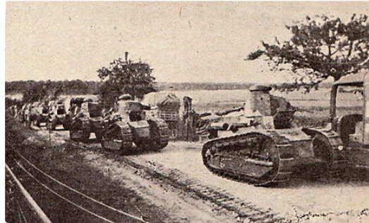
Il y a cent ans... 1918 : la victoire change de camp

À l'occasion du centenaire de la première guerre mondiale, la Société archéologique du Gers et les écrivains publics du Gers se sont associés pour vous faire découvrir la chronologie des événements marquants de la Grande Guerre, tels qu'ils ont été vécus par les Gersois, au travers des grandes batailles qui l'ont émaillée. Chacun d'eux sera l'occasion d'un article qui en reprendra les grandes lignes et s'appuiera sur des portraits d'hommes, soldats gersois, morts ou disparus. L'idée de cette série est de leur rendre hommage pour, qu'à travers eux, le sacrifice de tous ceux de 14 ne soit pas emporté par l'oubli, même cent ans après.