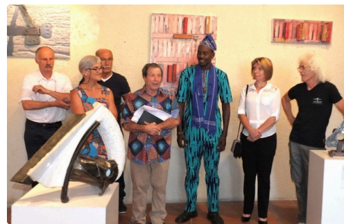
Lors du vernissage

Ouvert de 15h 30 à 18 h 30 du mardi au samedi et sur rendez-vous.