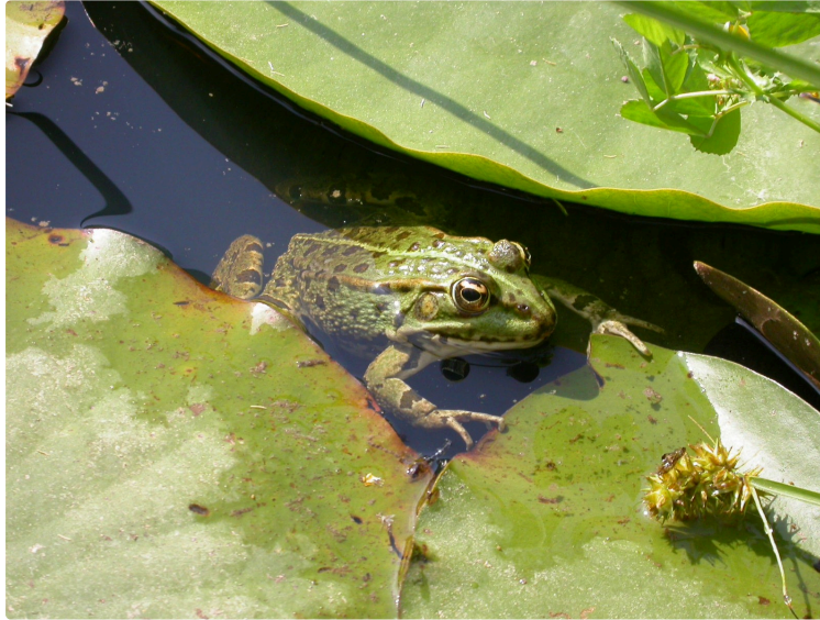
Eau et nature, les trésors du Gers

Pour son nouveau programme estival, le CPIE Pays Gersois propose aux petits et aux grands curieux de découvrir les trésors de l'eau et de la nature dans le Gers, à travers expositions photos, ateliers et balades pour toute la famille. Ces animations ont pour objectifs de :