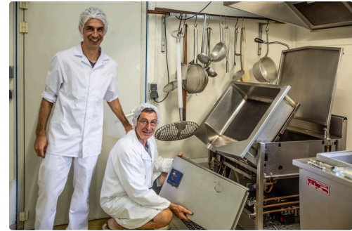
Devant une des machines (régulièrement entretenues)