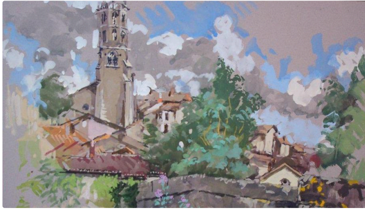
Les peintres de la Marine nationale exposent leurs vues sur le Gers