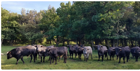
manade de Turquay