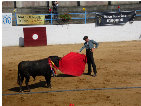
Solalito vainqueur à Castelnaud Rivière Basse