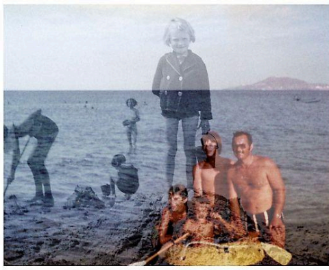
documentation collée devant ACROZONS M, 2006 - 2009 Installation vidéo, vidéo en 3D