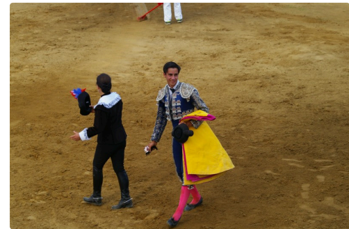
Solalito ici à Castelnau