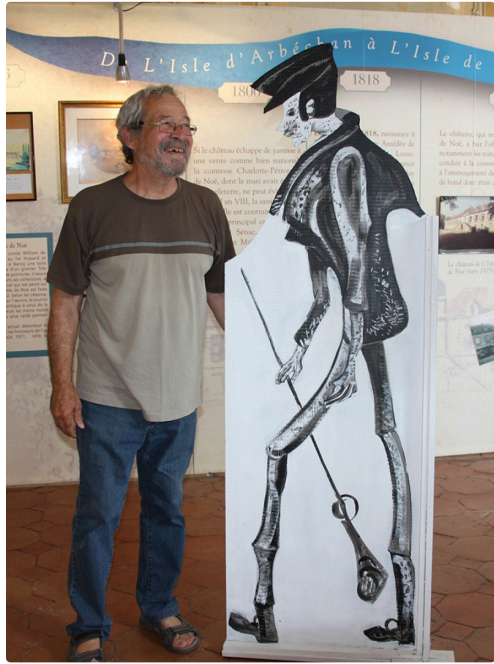
Cham vu par Dominique Bernier