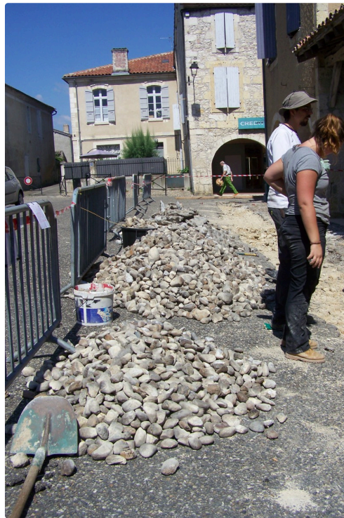
Perspective d'une des rangées de calades enlevées