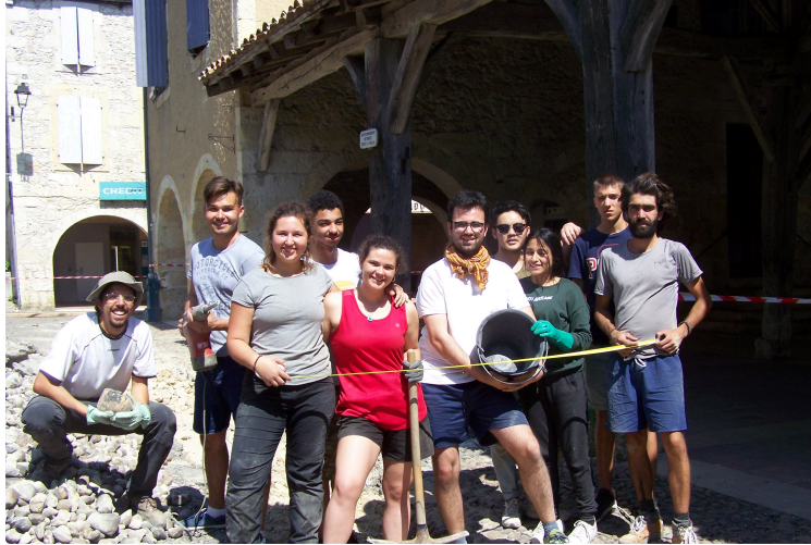
Une belle équipe de jeunes européens sur le chantier des calades (galets)