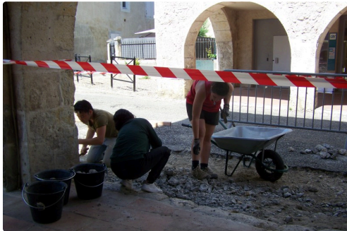
toiles jb laffitte à l'arcade et jeunes concordia à st clar 018.JPG