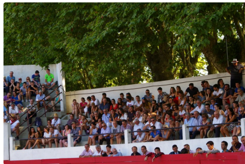
Un public nombreux et fidèle