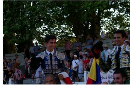
Solalito et Valencia heureux Photos Marcel Lavedan du 14 juillet 2018 Droits Réservés