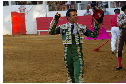
La seconde oreille e Valencia