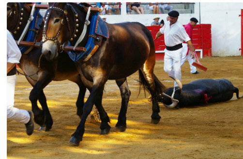
Les novillos ont été applaudis à l'arrastre