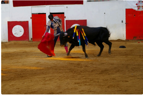
Solalito gagne sa seconde devant ce novillo