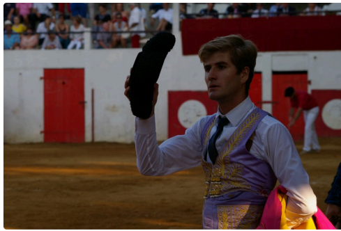
Il va faire des misères à Vilaiba