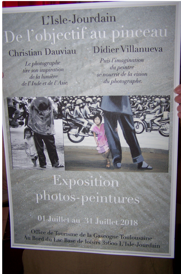
Des oeuvres artistiques par deux regards d'artistes, l'un photographe et l'autre peintre à l'Office de Tourisme de la Gascogne Toulousaine