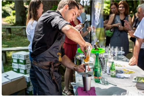
Confection d'un cocktail à la blanche d'armagnac