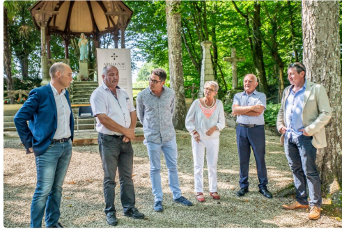
Panneau sur pupitre devant la chapelle du Tonneteau