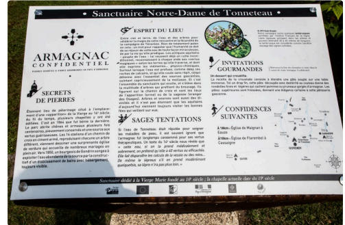
Panneau sur pupitre devant la chapelle du Tonneteau