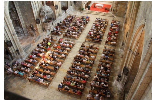
La cathédrale Saint-Pierre affichait complet pour ce premier concert.