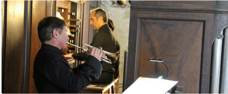
Le retour des Vespérales