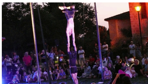
C'est parti pour les acrobaties.