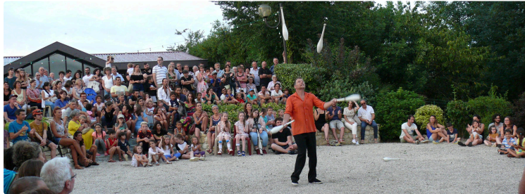
Gros succès du mardi de l'été

Plus de 300 personnes ont assisté au spectacle "Vadrouilles"