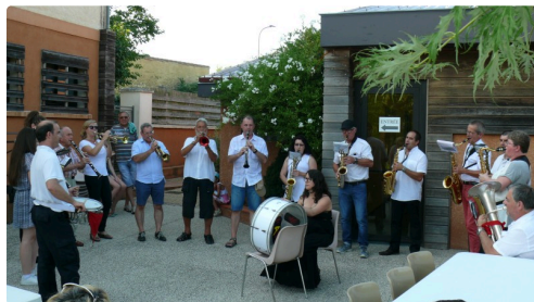
L'Astarac banda de Saramon anima musicalement la soirée.

Le spectacle se conclura sur le pré du kiosque où un couple de trapézistes exécuta leur art et prouesses acrobatiques dans le décor sublime d'un coucher de soleil. Puis le rideau tomba sous une belle nuit étoilée.