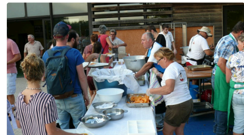
Les bénévoles du comité des fêtes au service.