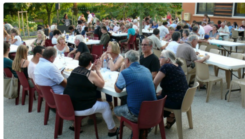
Beaucoup de monde pour l'avant spectacle.