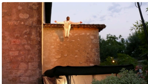
Belle envolée de l'artiste.