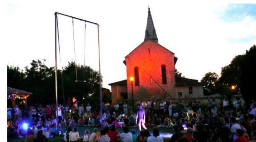
Les trapézistes entrent en scène sous un beau coucher de soleil.