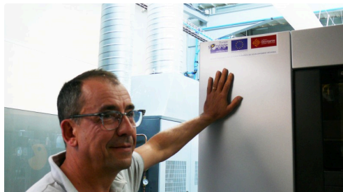
Les organismes qui ont subventionné pour partie le projet ont leurs logos collés sur la machine.

Enfin et ce n'est pas la moindre des choses, l'imprimerie BCR est labellisée Imprim'Vert et vient d'obtenir en juin 2018 la certification PEFC (Promouvoir la gestion durable de la forêt), alors que l'agrément FSC (Conseil de Soutien de la Forêt) est en cours.