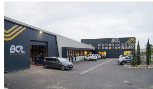
Les locaux extérieurs.(Photo : BCR).