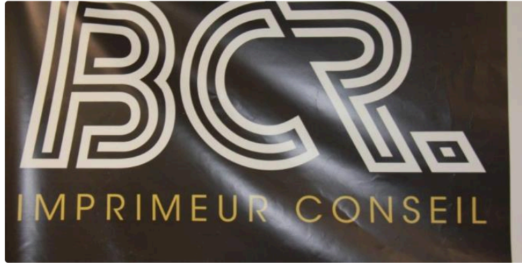
Labellisée Imprim'Vert et certifié PEFC, l'imprimerie BCR poursuit son développement