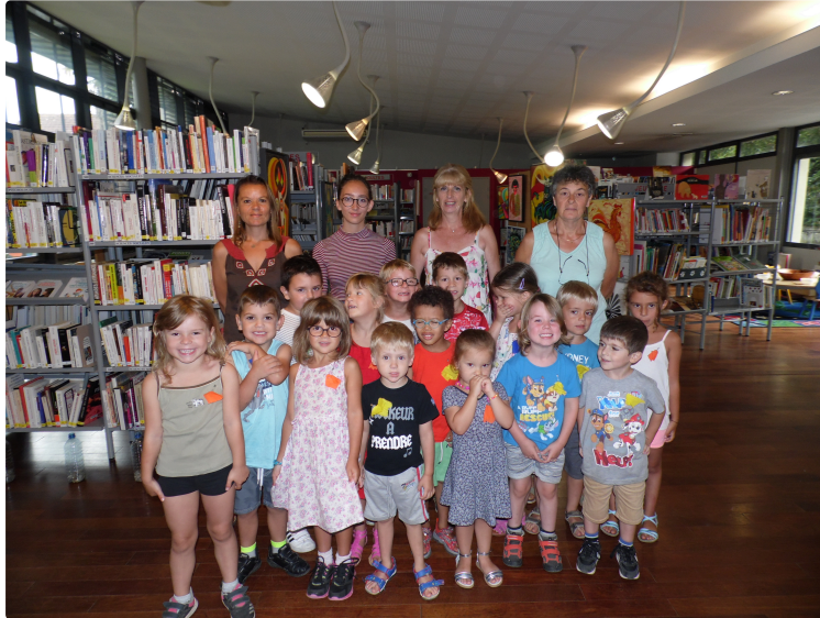
Le centre de loisirs accueilli en deux fois à la médiathèque