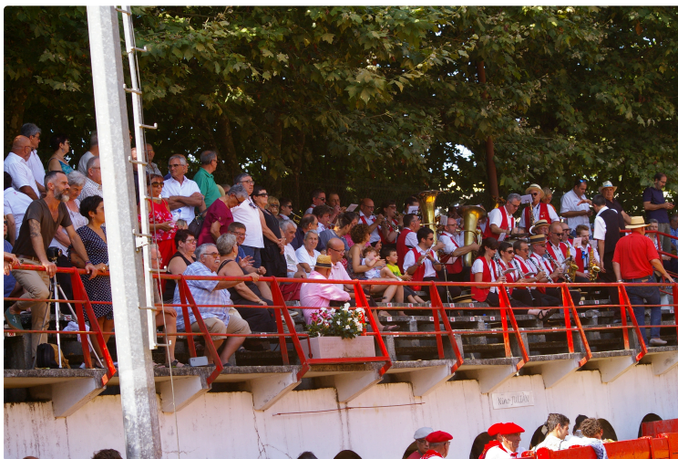
Novillada non piquée de Riscle samedi matin

Deux oreilles , il aurait pu y en avoir quatre