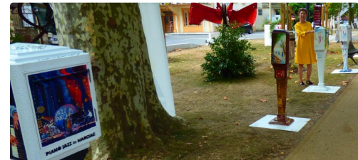
les boîtes à lettre