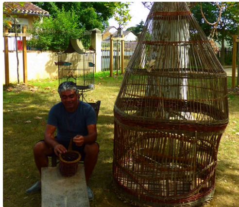
la cage aux oiseaux de Louis

Une exposition d'un ensemble plein d'intérêt.