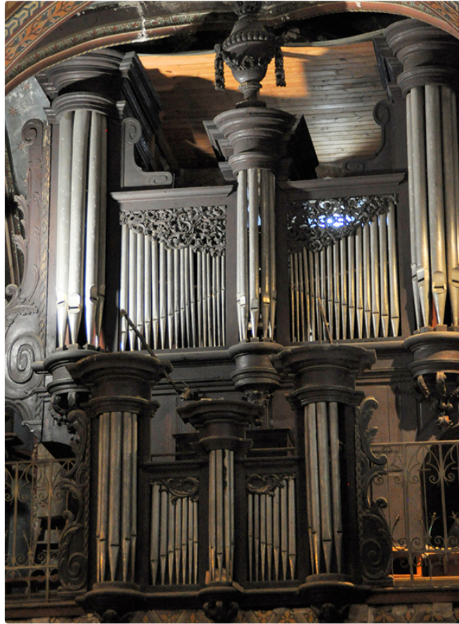
Orgue et voix un concert dans la collégiale