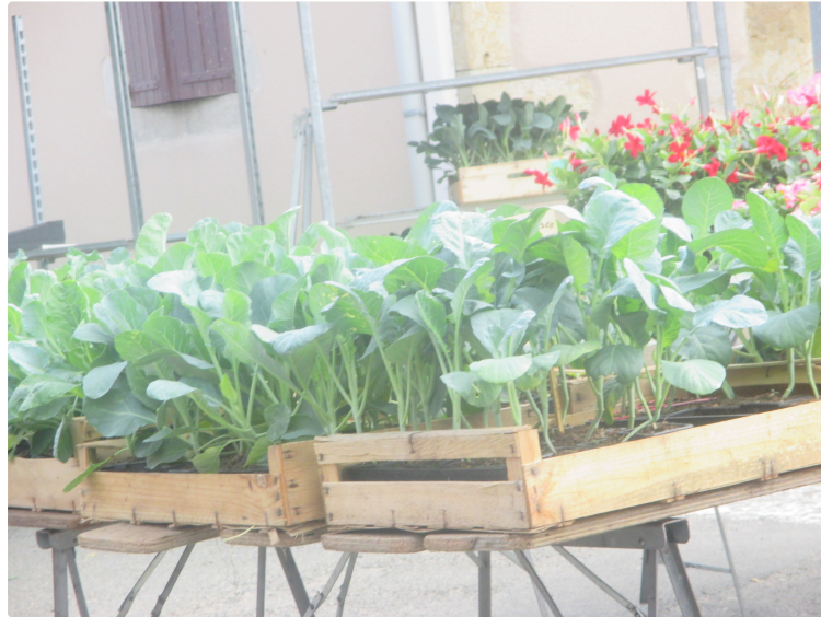
La foire du 16 Août

Aux Peyris , plants de choux, furets et Escargots