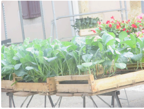
Les plants de choux